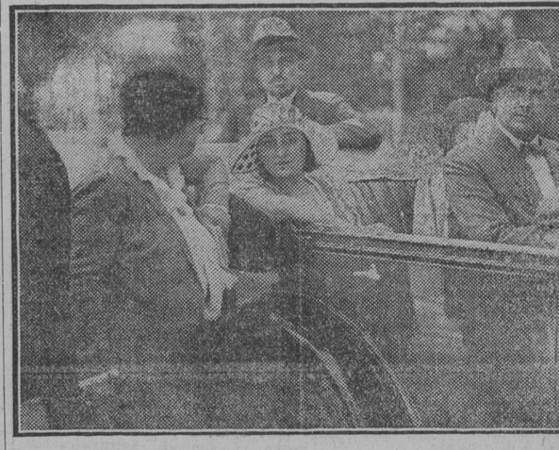
La señorita Edda Mussolini paseando en auto por el recinto de la Exposición.

Un salón preferente en el patio, frontero á la escalera de honor, lo ha dedicado Colombia á la prensa y al libro, demostrando con ello la importancia que da el Gobierno á estos aspectos de la cultura.