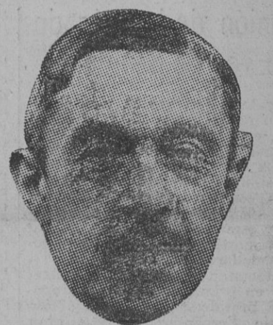
El teniente coronel don Emilio Herrera, que sobreponiéndose a la irracionalidad y a la angustia generales, muestra optimista sobre la suerte del comandante Franco y sus compañeros de arado.

El pueblo argentino recuerda con cariño en estos momentos de emoción a los bravos tripulantes del «Plus Ultra», que cubrieron de gloria a la aviación española, escribiendo su página más brillante. La inquietud aquí es muy grande con respecto a la suerte que haya podido haber a los gloriosos aviadores, que por segunda vez se han lanzado a la aventura de realizar la travesía del Atlántico, esta vez por la ruta del Norte. La Prensa refleja el interés del público en extensas informaciones relativas al vuelo emprendido por Franco y sus compañeros en el «Dornier, número 16». También publican las periódicas fotografías de los aviadores con artículos biográficos de los mismos, haciendo resaltar el destacado de sus personalidades en la aviación mundial. La información, como antes decimos, es muy extensa, pues en ella aparecen cuantas noticias llegan referentes al vuelo. También publican artículos editoriales de personalidades destacadas en la aviación, para deducir que aún no se puede afirmar la pérdida del «Dornier», y hacen votos porque pronto se tengan noticias concretas acerca de su paradero. Las redacciones de los periódicos se ven constantemente asediadas por personas de la colonia española que acuden a ellas en demanda de noticias. Puede decirse que en estos momentos la emoción en la Argentina es tan intensa como en España.