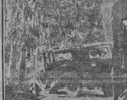
Por la forma en que quedaron ambos vehículos se ve que el coche de Gitanillo trató de ganar la cara a la camioneta, sin que pudiera conseguirlo.

Según los ocupantes de la camioneta, ellos venían por su derecha. El que quiso pasar los carros fué el chófer del coche de Gitanillo. Los pasó y al coronar la cuesta, cuando pretendía colocarse a su derecha, se encontró con la camioneta, a la que quiso «ganar la cara», pasando medio coche y tropezando el