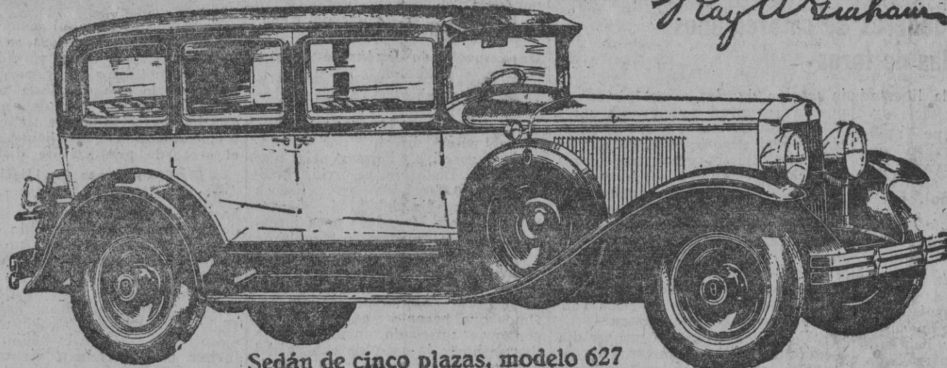
Sedán de cinco plazas, modelo 627