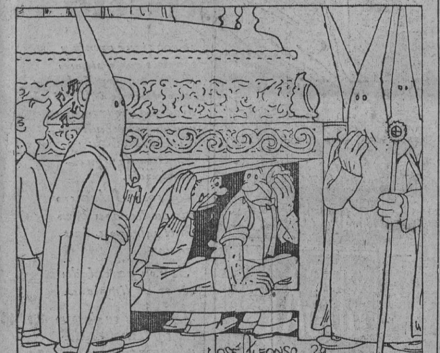
—Este «paso» es pesadísimo. Yo estoy ya completamente deshecho. —Y yo también. Me parece que nos hemos metido en un mal paso.