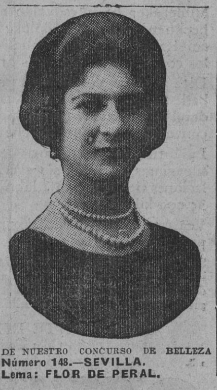
DE NUESTRO CONCURSO DE BELLEZA Número 148.—SEVILLA. Lema: FLOR DE PERAL.

junión de nuestros pueblos, en plena vida de hoy, no es la hora más oportuna para abrir el libro del intercambio. Basta y sobra con que España y América aparezcan juntas, produciendo el espectáculo esplendoroso de la Exposición.