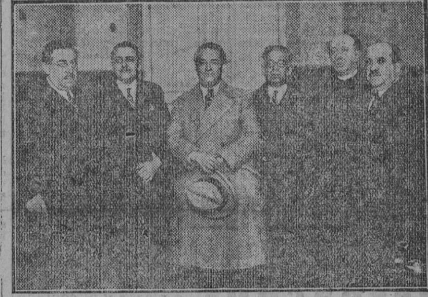
Llegada á Sevilla del famoso tenor Hipólito Lázaro.