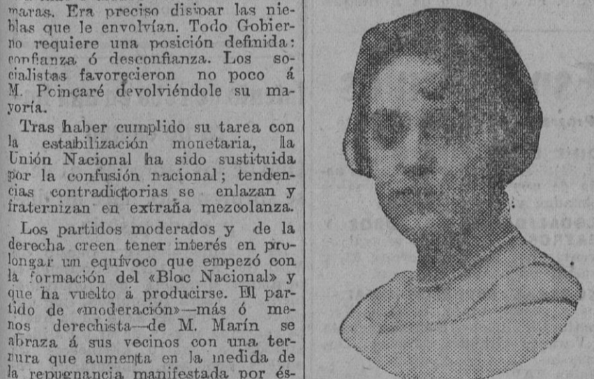
DE NUESTRO CONCURSO DE BELLEZA Número 114.—SEVILLA. Lema: MIRAFLORES.

ESTE NUMERO HA SIDO VISADO POR LA CENSURA