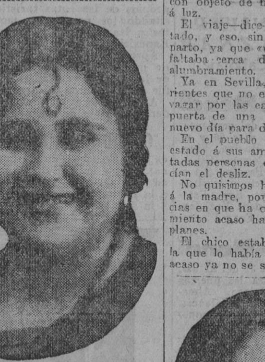
DE NUESTRO CONCURSO DE BELLEZA Número 147.—SEVILLA. Lema: ALEGRIA.