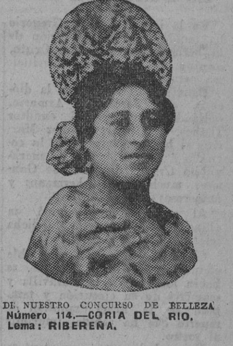
DE NUESTRO CONCURSO DE BELLEZA Número 114.—CORIA DEL RIO. Lema: RIBERENA.