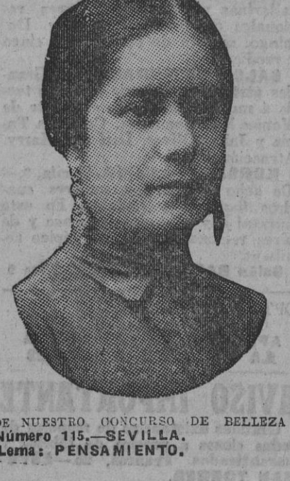
DE NUESTRO CONCURSO DE BELLEZA Número 118.—SEVILLA. Lema: PENSAMIENTO.

Muerte del conde de López Muñoz Madrid 15.—Esta mañana, a las diez, ha fallecido el ex ministro don Antonio López Muñoz, conde de López Muñoz. Desde hace algún tiempo hallábase enfermo de bastante gravedad y su muerte ha sido la consecuencia de un ataque de uremia. Durante bastantes años desempeñó la Embajada de España en Portugal. Desempeñó las carteras de Estado, Instrucción pública y Gracia y Justicia. En posesión de ésta se encontraba en el último Gabinete de hombres buenos que presidía el marqués de Alencenas. Entonces, en funciones de notario mayor del reino, asistió al acto de tomar juramento al nuevo Presidente, general Primo de Rivera. El conde de López Muñoz perteneció siempre a los partidos de la izquierda dinástica y fué catedrático de los Institutos de Granada y Madrid.