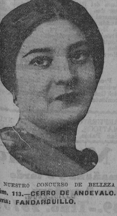
DE NUESTRO CONCURSO DE BELLEZA Número 113.—CERRO DE ANDEVALO. Lema: FANDAGUILLO.