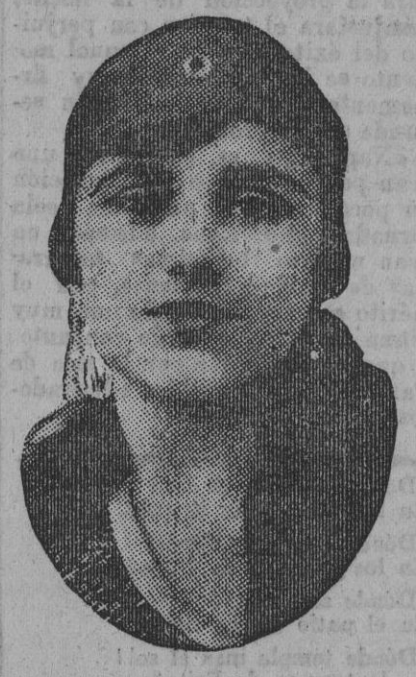
DE NUESTRO CONCURSO DE BELLEZA Número 115.—SEVILLA. Lema: ARRIBA EL LIMON.

pondientes a las cuatro anualidades siguientes: si faltan menos de cuatro, a las que resten; y si es amortización parcial, la comisión será la que correspondiera en cuatro años por la cantidad que se anticipa. Y sintiendo tanto el ser molesto, como poder merecer de algunos el calificativo de exhibicionista, que todo tranquilo, por entender que cumplí con el deber que todo ciudadano tiene de exponer sus opiniones en asuntos que afectan al bien general y que con el silencio no se cumple con aquéllos, pues bien dice el refrán que "el que calla, otorga". De usted atento amigo, seguro servidor, q. e. s. m. Antonio Borbolla. Marzo, 1929.