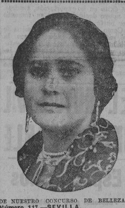
DE NUESTRO CONCURSO DE BELLEZA Número 117.—SEVILLA. Lema: ROSA ENTRE ESPINAS.

La reina María de Rumania y la princesa Ileana visitarán la Exposición de Sevilla Bucarest 15.—La Reina María de Rumania y su hija, la princesa Ileana, saldrán mañana con dirección a España. La Reina María se propone pasar una temporada con su hermana la princesa Beatriz, esposa de don Alfonso de Orleans. Durante su estancia en España se proponen visitar las Exposiciones de Sevilla y Barcelona. Después la Reina María y su hija marcharán a Inglaterra y de allí irán a París, donde aquella se entrevistará con su hijo el príncipe Carol.