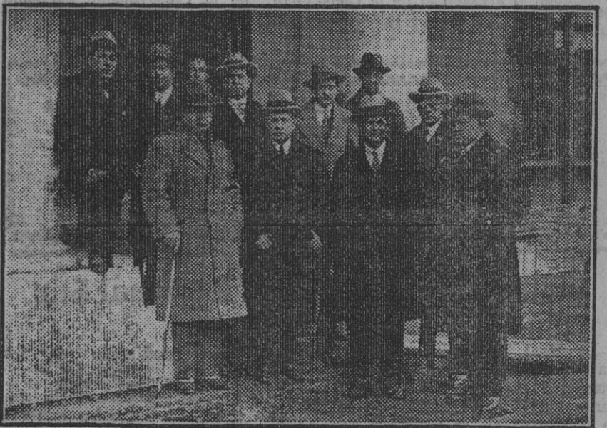
El Embajador cubano durante la visita al pabellón de su país.

Elogio asimismo el embajador el hermoso mapa de Cuba dispuesto para la exhibición, y finalmente subió al tercer piso del pabellón permanente, viendo el bellissimo artefacto que está á punto de terminarse y que constituye una extraordinaria obra artística de incalculable valor.