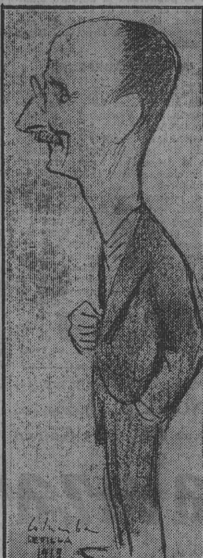
Magnífico apunte del ilustre arquitecto don Aníbal González debido al ágil y expertísimo lápiz del distinguido dibujante argentino don Ramón Columba, que anoche marchó a Madrid en unión de su joven y bella esposa.

El haber emitido su voto por una de las concursantes no es obstáculo para hacerlo por otra, en cuanto pueden aparecer fotos con nuevos atractivos de belleza que obliguen a repetir el sufragio.