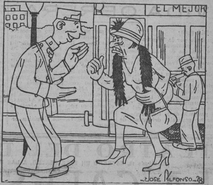
—Oiga, cobrador; en el tranvía hay un tío indecente que se ha estado metiendo conmigo. Le he amenazado; pero no me ha hecho caso. —¿No ha logrado asustarlo usted? Entonces no hay quien lo eche.