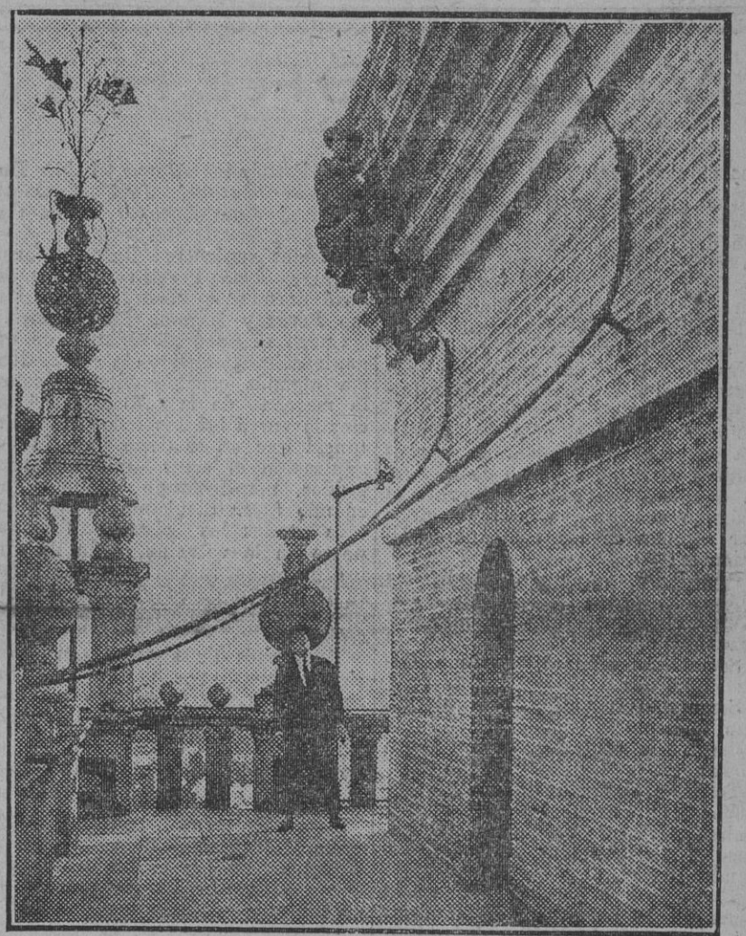
—Yo subo por ahí! Yo quiero tener un recuerdo de esta torre, como no hay otra en el mundo...

Reiteran su gratitud á cuantos voluntarios se han ofrecido, y como, seguramente, no será éste el único espectáculo que se organice con el mismo fin, esperan poderlos aceptar en fecha próxima.