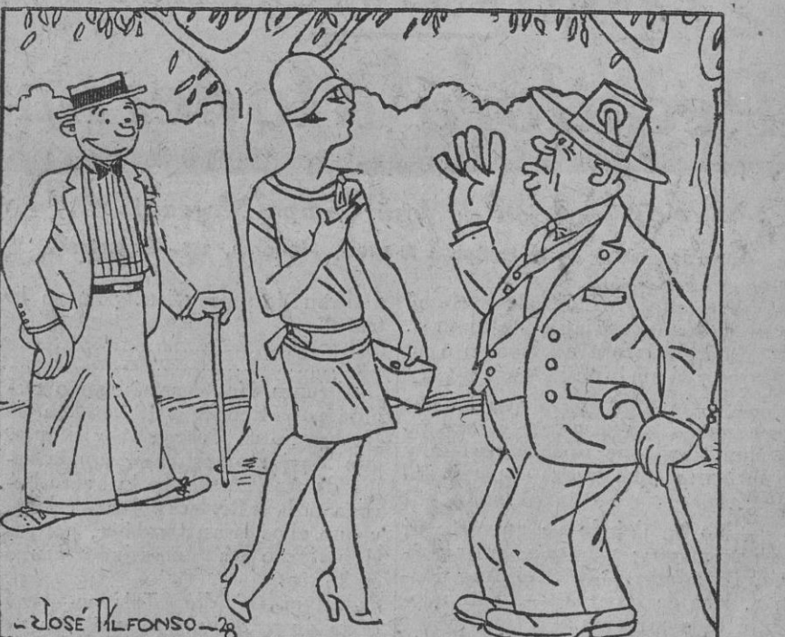
—Oiga, guarda; ese joven me acaba de robar un beso. —Tranquílese. ¡Yo me encargo de que se lo devuelva ahora mismo.