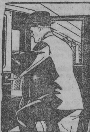
Una posición única y preferente es la alcanzada por el Buick entre los hombres de negocios