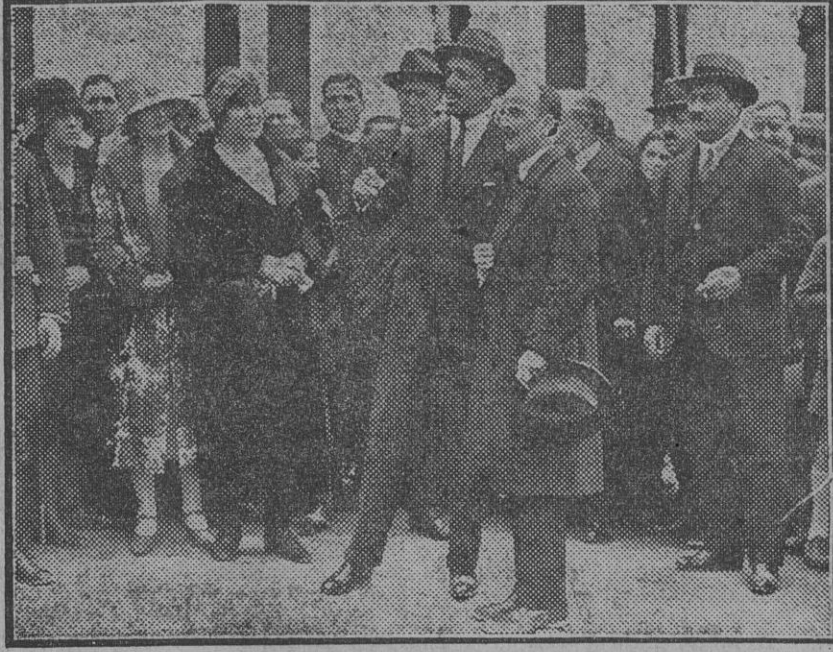
1.-Don Alfonso saludando a la marquesa de Villapanés a su llegada al lugar en que se erigirá el templo a la Virgen Milagrosa en la huerta del Rey. 2.-Don Alfonso informados por el ilustre arquitecto don Aníbal González de los detalles relacionados con el emplazamiento y la construcción del futuro templo de la Virgen Milagrosa.