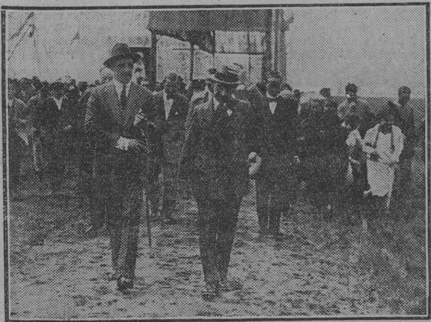
El Rey y el director de la Sociedad «Islas del Guadalquivir», Mr. Fisher, saliendo del poblado «Alfonso XIII» después de la colocación de la primera piedra de la futura iglesia de Nuestra Señora del Carmen.

La entrada al terreno de emplazamiento será pública, asistiendo al acto SS. MM., infantes y autoridades.