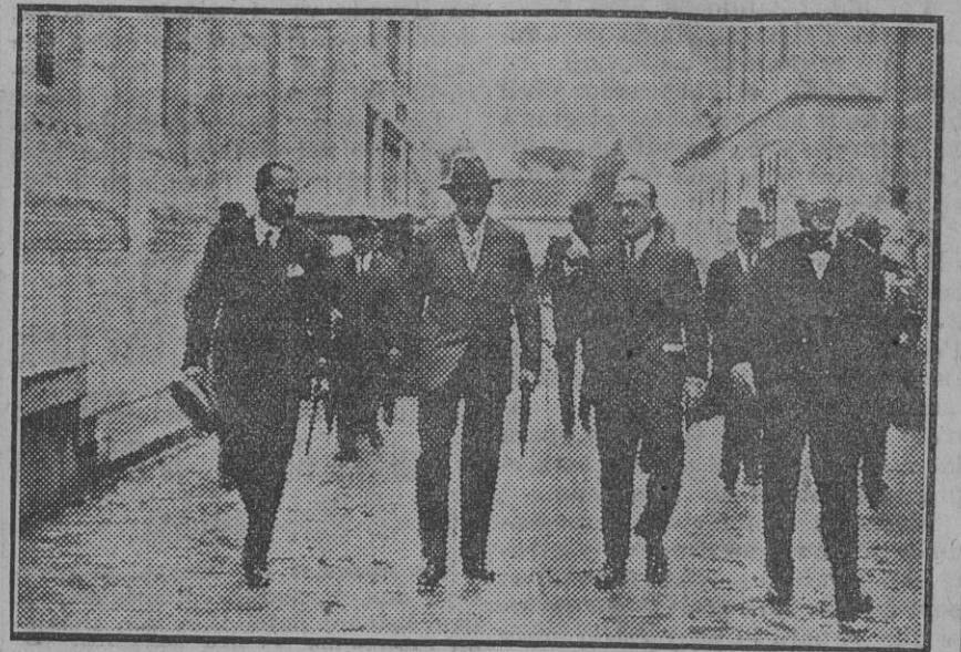
Su Majestad el Rey a su llegada a la Factoría de Tabladilla para presidir el solemne acto celebrado ayer

tomando el té con la aristocrática dama.