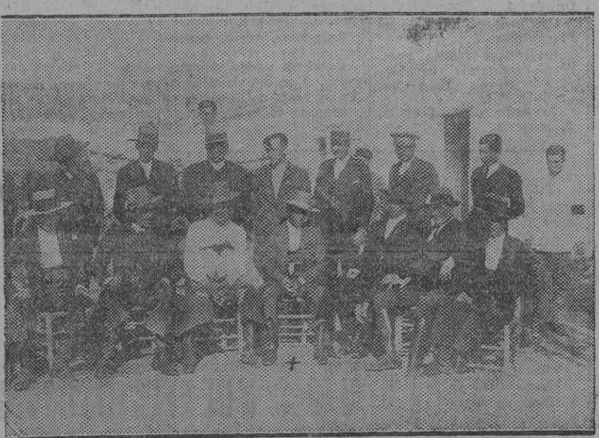
El famoso diestro Juan Belmonte (+) con los invitados a las faenas de fiesta celebrada en el cortijo de Fuente Vinaza.

Manster 28.—Se ha descubierto un cuadro que, según el examen de los peritos, representa una madonna de Rafael. Dicho cuadro ha sido tasado en un millón de marcos oro, a cabo tal propósito.