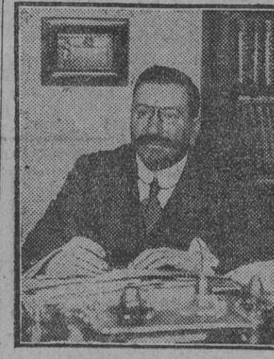
DON JUAN VAZQUEZ DE MELLA. Ilustre orador tradicionalista que falleció en Madrid el domingo último.