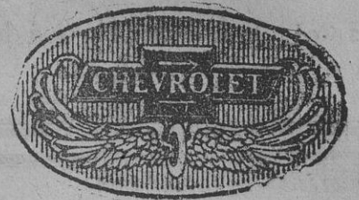
Por sus líneas e inimitables características, el Chevrolet es siempre un coche de gran lujo