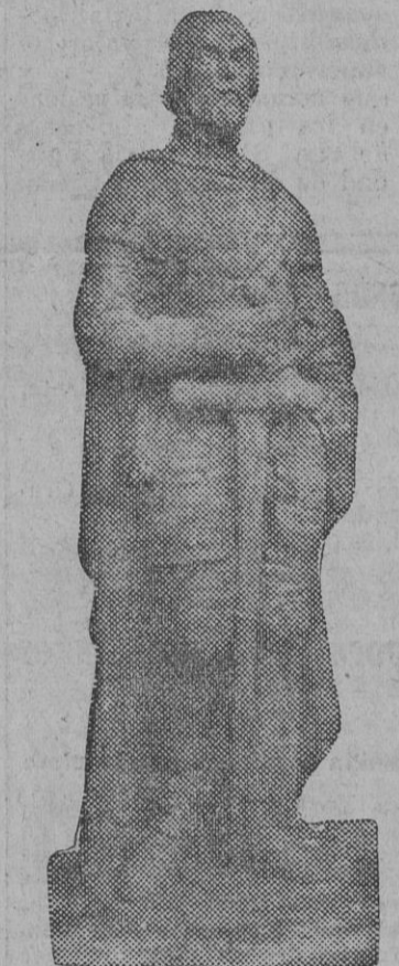
Modelo de la estatua de Hernán Cortés que costea el Centro Cultural del Ejército y de la Armada, secundando brillantemente una iniciativa nuestra.