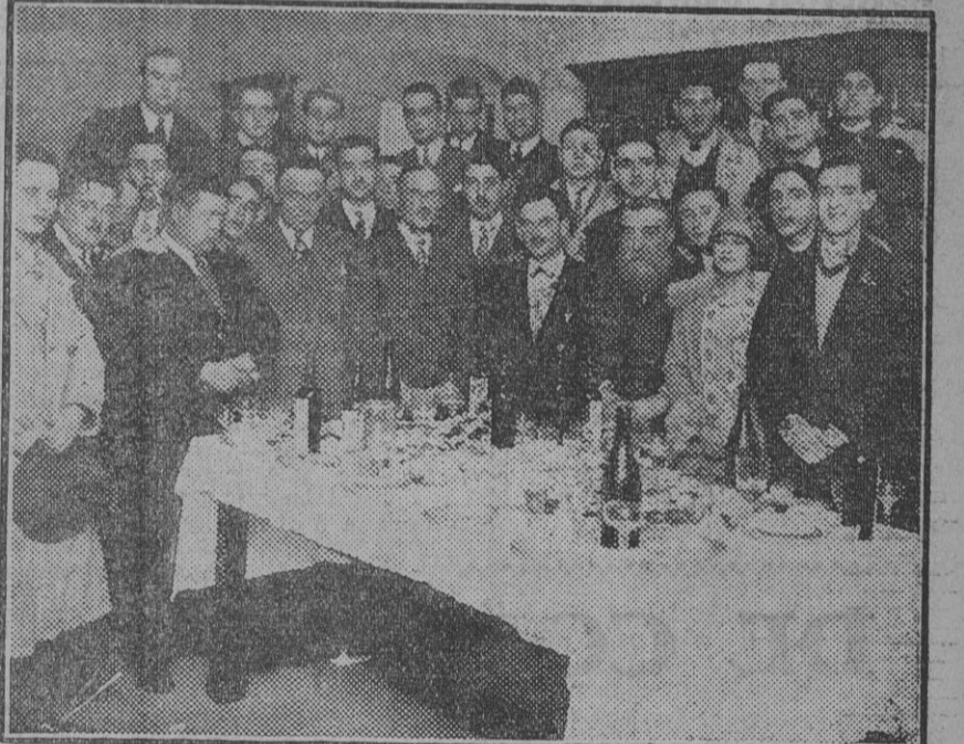
«Lunch» ofrecido en las bodegas de Domecq, de Jerez de la Frontera, á los excursionistas de la interesantísima revista científica «Archivos Sevillanos».