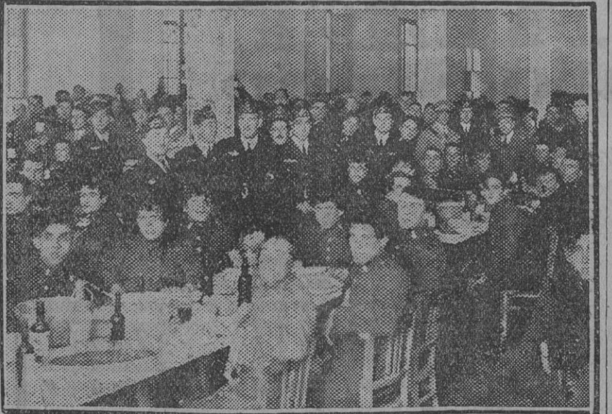
Un aspecto del comedor de tropa en el momento de servirse la comida extraordinaria. (Fdo. Gori.)