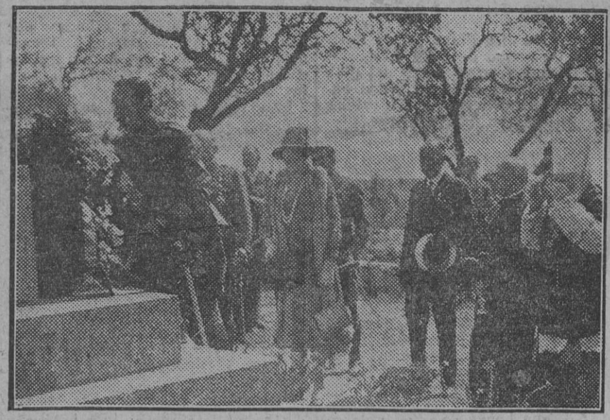
TETUAN.—El Rey colocando una corona en el panteón de los soldados muertos en campaña.