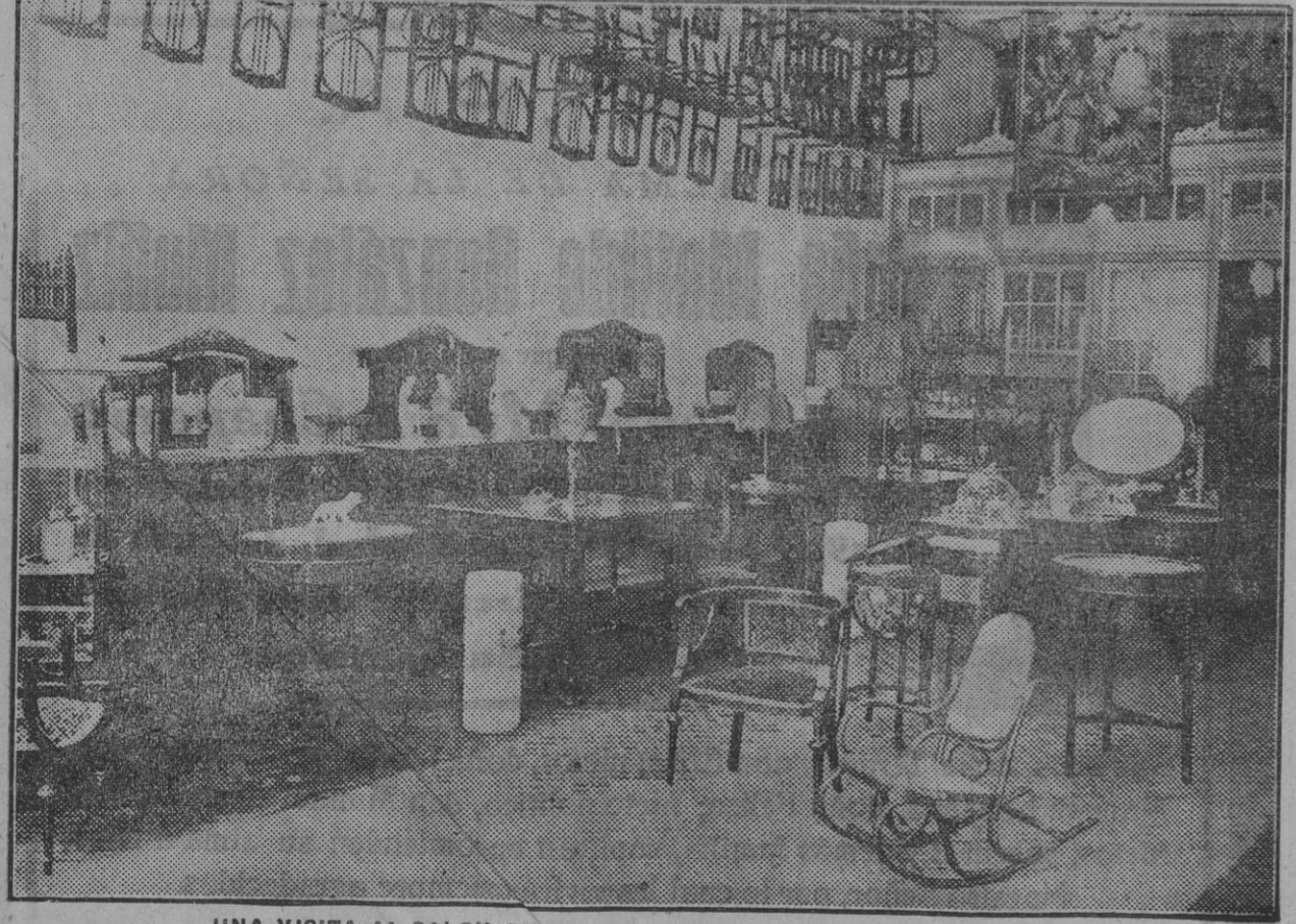
UNA VISITA AL SALON EXPOSICION POR LA CALLE AMOR DE DIOS

Publicidad GALERIN.