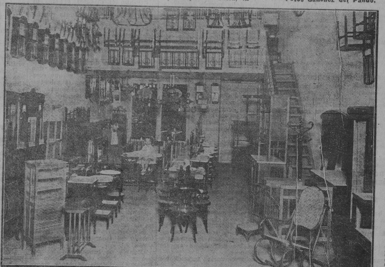
UNA VISITA AL SALON EXPOSICION POR LA CALLE TRAJANO