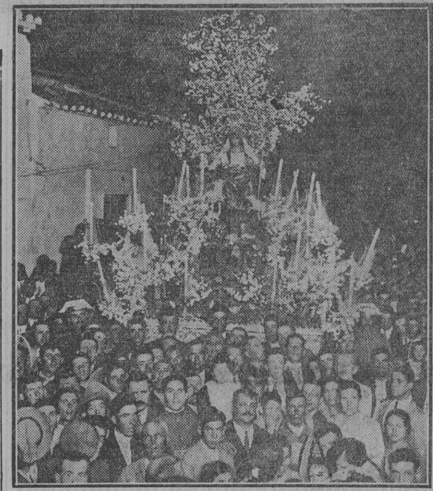
El «paso» con la imagen de la Divina Pastora, sacado ayer en procesión.

Si podemos, trataremos de describir lo que vimos anoche en el barrio de Cantillana con motivo de la procesión de la Madre de Dios, como le dicen las cantillaneras a su Divina Pastora.