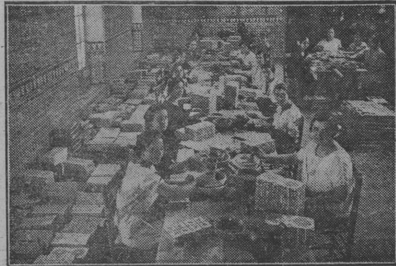
Los azulejos de Triana son tan bonitos porque en ellos se reflejan las caras de las lindas muchachas que los pintan.