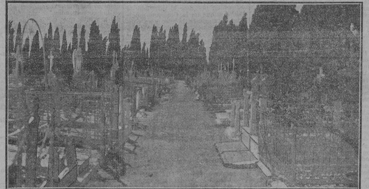
Aspecto actual de una calle de sepulturas de primera clase.

de años tiene nuevo sitio donde descansar. Cada diez años muestra sus huesos al sol. ¡Lo que se pasean nuestros huesos!... ¡Claro que los paseos son mientras la familia pague, que si no abona lo estipulado van a parar al osario común, donde termina ya para siempre la odisea. Este alquiler de los diez años, esto de no admitir la renovación de