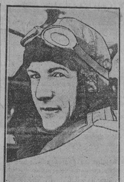
El capitán aviador francés Nungesser, tripulante con su compañero M. Goli de 'El Pájaro Blanco', que inició el raid París-Nueva York y cuyo paradero se desconoce.