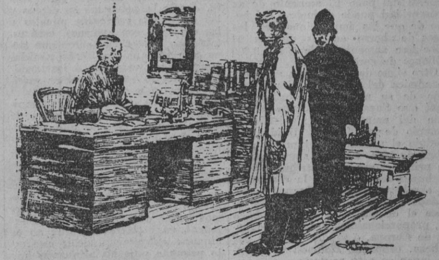
—Está usted acusado de haber sustraído dos sacos de carbón de a cien libras cada uno.