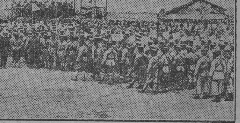
Fuerzas del Sur (bolcheviques) durante un mitin. cerca de 500 kilómetros a vuelo de pájaro de la costa.

Nanchang, en la provincia de Kiang-Si, se encuentra a 140 kilómetros al Sur de Yang-Tsé y