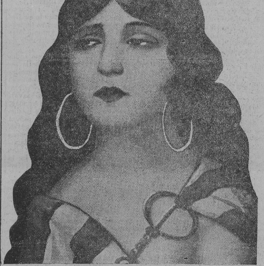
Kabila, la protagonista de la intersantísima novela «Odio de árabe», cuyo primer capítulo publicamos hoy.

El odio contra los enemigos de su raza y de su religión es inex-