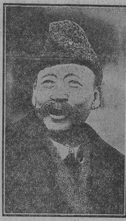
DE LA REVOLUCION CHINA El mariscal Tsao-Kun, que fue prisionero al principio de la revolucion y que está defendiendo el régimen cristiano.