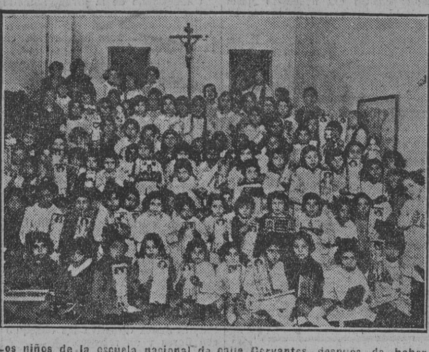
Los niños de la escuela nacional de calle Cervantes, después de haber recibido los regalos de Reyes donados por el Ateneo.