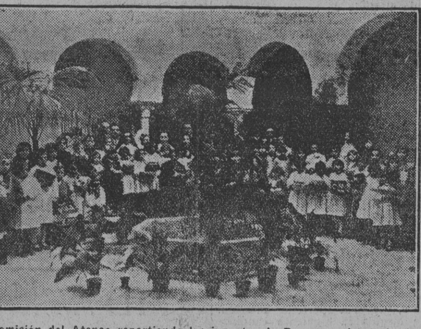
Comisión del Ateneo repartiendo los juguetes de Reyes en el colegio del Buen Pastor.