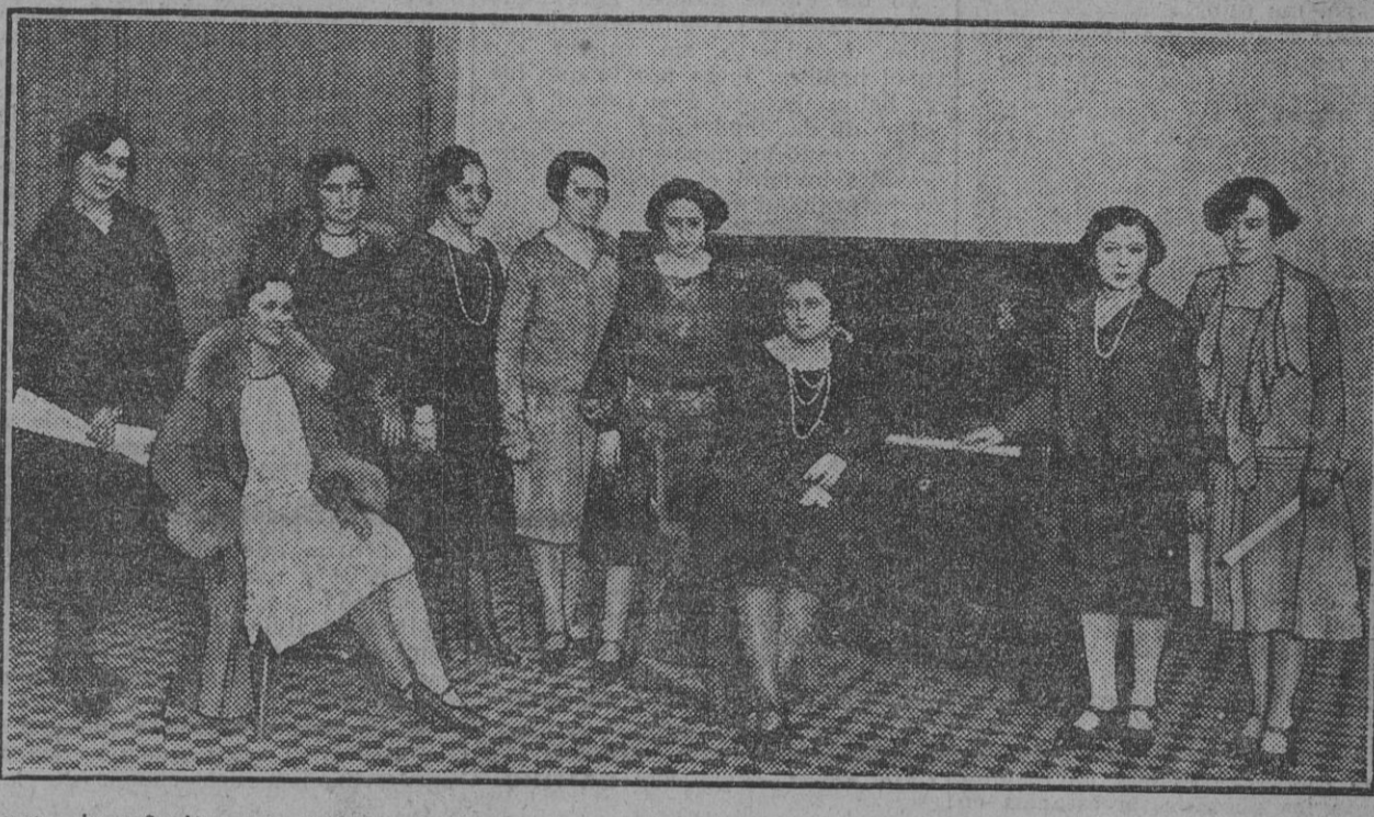
Grupo de señoritas que tomaron parte en la velada musical celebrada anoche en la Sociedad Económica con motivo de las fiestas de Santa Cecilia.

Berlín.—Comunican de Tyrolen que un pintor alemán, padre de tres hijos, manifestó que lamentaba que Mussolini hubiese salido ileso del último atentado. Un grupo de fascistas arremetió inmediatamente contra él, procediendo a su linchamiento. Después de ser arrastrado, su cadáver fue arrojado a un río.