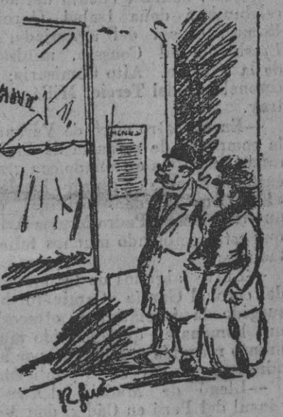
—Mira; si te parece, entraremos. Aquí cuando no hay hambre se come muy bien...