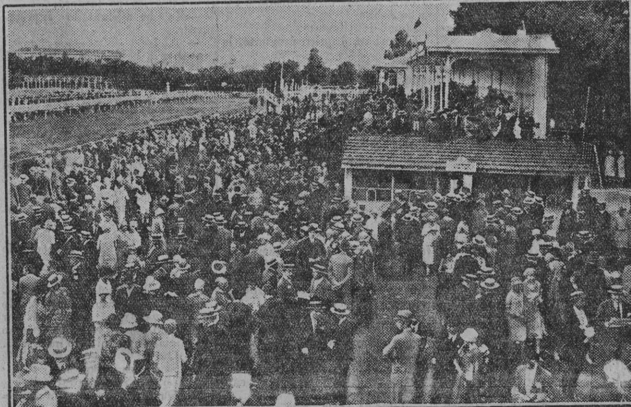
MADRID.—Aspecto del Hipódromo de la Castellana durante la carrera del Gran Premio de Madrid.