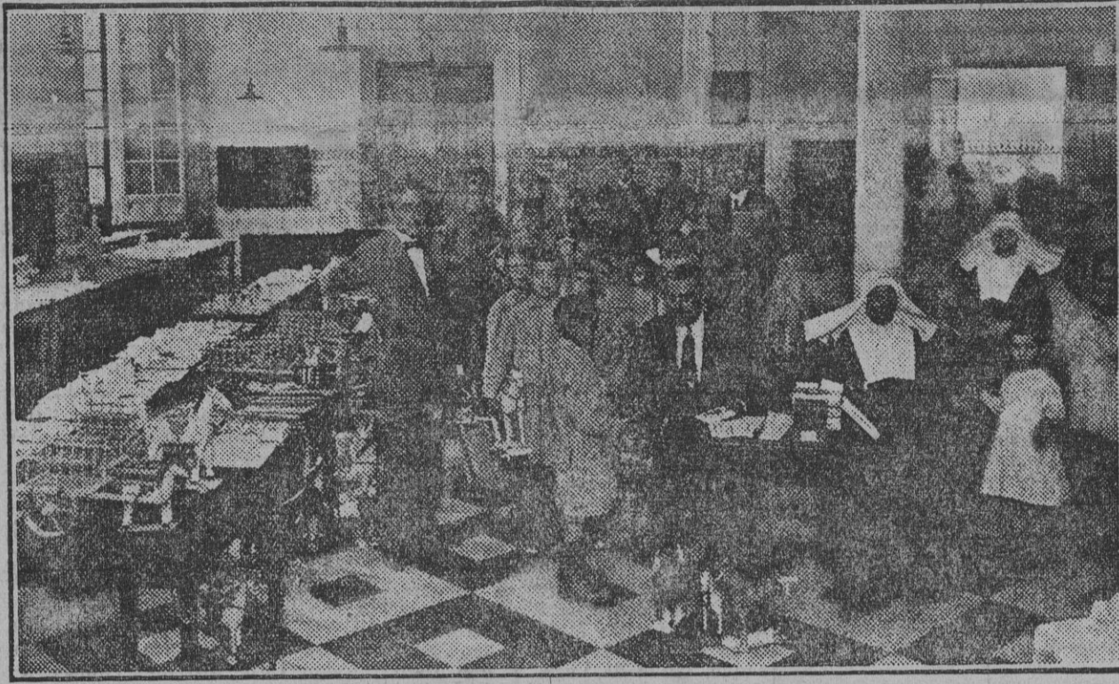
Reparto de premios a los niños del Hospicio con motivo de fin de curso. (Fdo. Gori.)