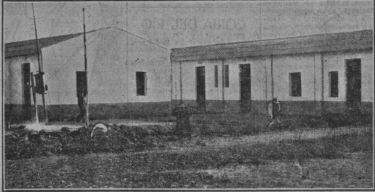
El aspecto de la gran plaza en construcción, de la barriada Vázquez Armero.

rección de las cartas puede ser así: «Don Fulano de Tal, Barriada de Vázquez Armero, calle primera (hasta ocho), número 182. Cerca de la Cartuja, Triana.—Sevilla.» (Que si van á llegar las cartas?; Ya lo creo!; Y los telefonemas!)