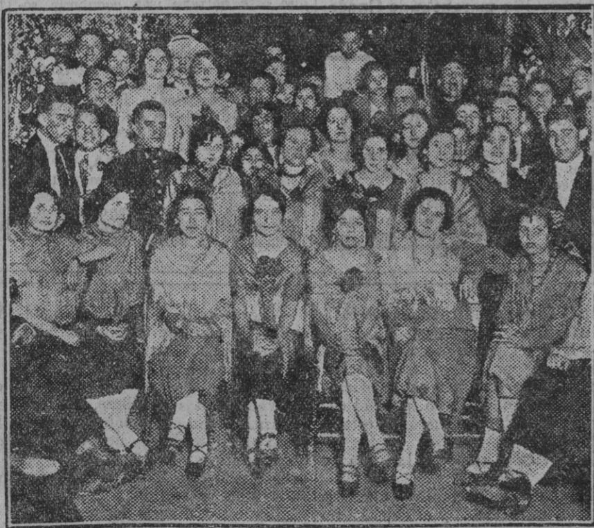
Cruz de Mayo de calle San Juan, 28.