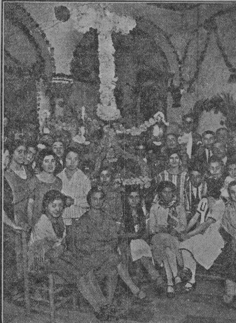
Cruz de Mayo de calle Sol, 11. Fdo. Gori.

Después se verificó en el cuartel un reparto de premios a los soldados de mejor comportamiento.