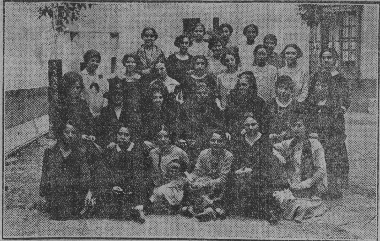
Alumnos de la Escuela Normal de Maestras que han terminado en el presente curso la carrera del Magisterio.

No olvidemos la enseñanza del monte camaleón. Todo Marruecos no es más que eso: un monte que cambia de color constantemente. Y hay que estar a tono con el tono. CHERIF-EL-MADINI.