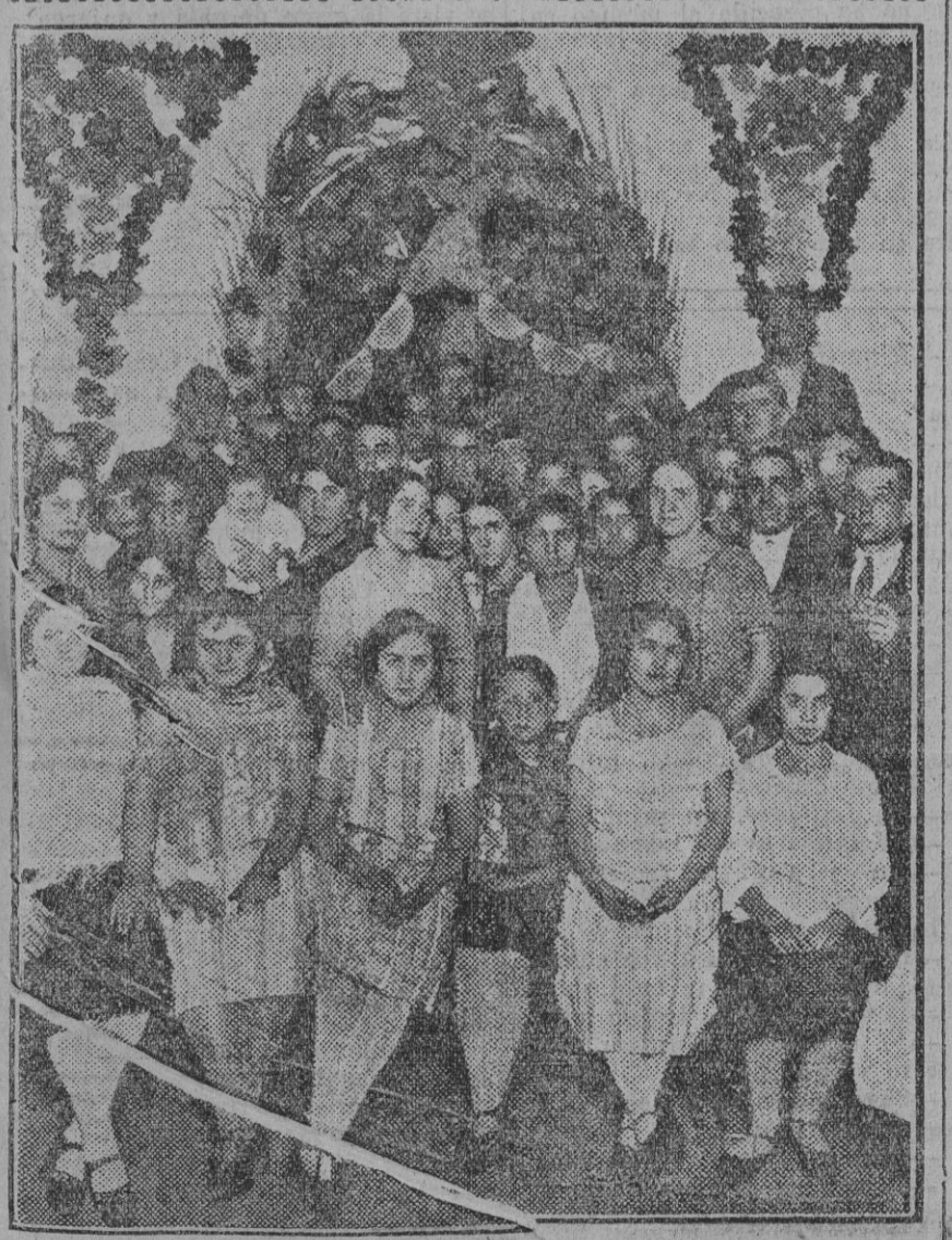
Cruz de Mayo de calle Recaredo, 15. Fdo. Gori.