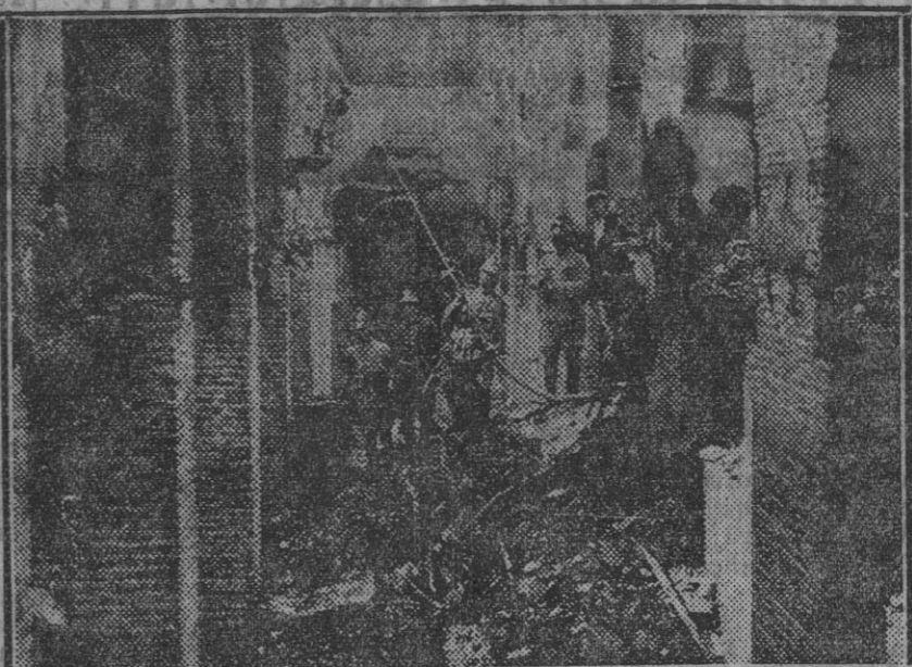
Aspecto de una de las naves del garage del señor Mauri, en la calle Castellar, después del incendio de anoche.

Varsovia 19.—El nuevo ministro del Interior ha declarado a los periodistas, con relación al estado de sitio, que no hay la menor base legal para implantarlo y que el Gobierno actual está firmemente resuelto a observar las leyes de un modo estricto. Los servicios de Correos, Telégrafos y Teléfonos funcionan ya normalmente; la censura militar para las conversaciones ha sido suprimida, y desde ayer está suprimida la censura para la Prensa.