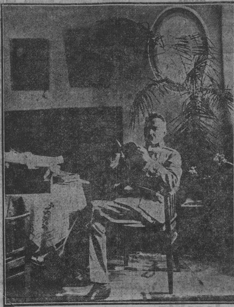
El mariscal Joseph Pilsudski, que ha dado el golpe de Estado en Polonia, derribando al Gobierno Witos y proclamando la dictadura izquierdista.

El señor Cruz Conde escuchó las manifestaciones del señor Adame, y con respecto al litigio entablado le indicó que el asunto lo resolverán los Tribunales.