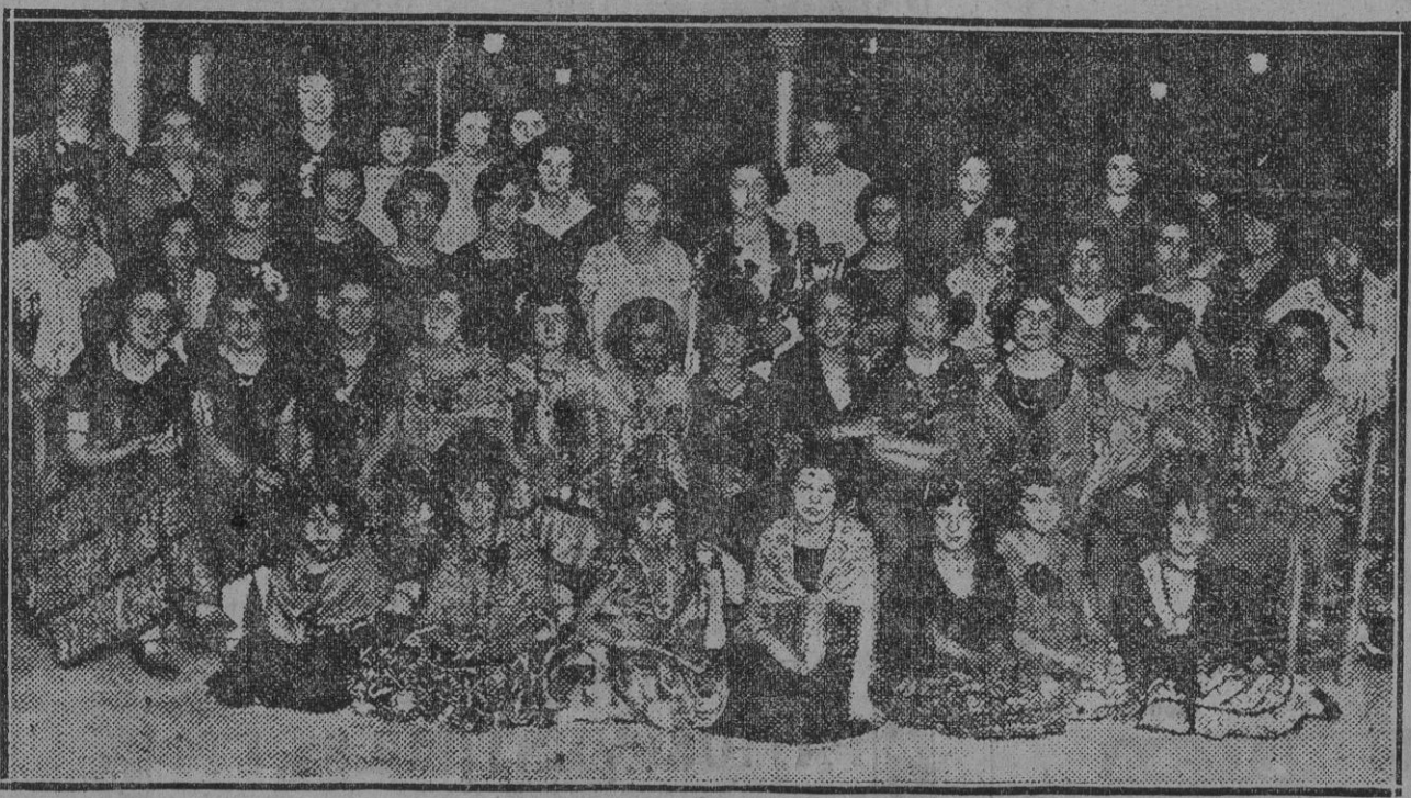
Grupo de lindas concurrentes á la caseta del Circolo Mercantil, en uno de los contados minutos de descanso que tuvo la fiesta.

En Barcelona causó gran sensación la noticia del choque de trenes.