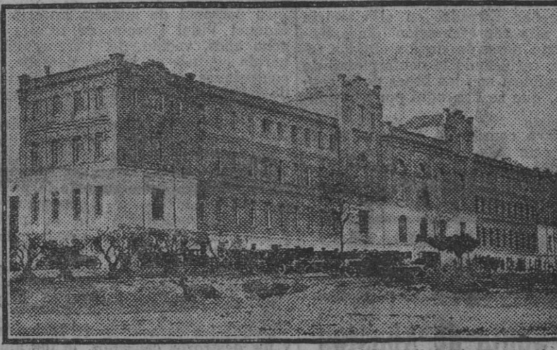
GAZPARRELL (MADRID).—Magnífico edificio construido para el Reformatorio «Príncipe de Asturias», institución auxiliar del Tribunal tutelar para niños de Madrid, cuya inauguración se celebró el día 10.

ESTE NUMERO HA SIDO VISADO POR LA CENSURA