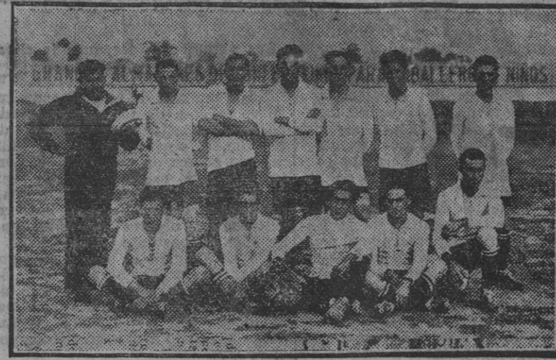
SEVILLA.—La selección argentina de fútbol del crucero «Buenos Aires» que ayer ganó un partido al equipo formado por estudiantes sevillanos.

El espíritu que alienta las doctrinas del fascio inspirase en este imperialismo tradicionalista de la civilización italiana. La unidad de Italia conseguida, la política de expansión no es la de Italia, es la de Roma. Roma es la que movilizó sus viejas energías, ávida de volver a alcanzar las antiguas supremacías.