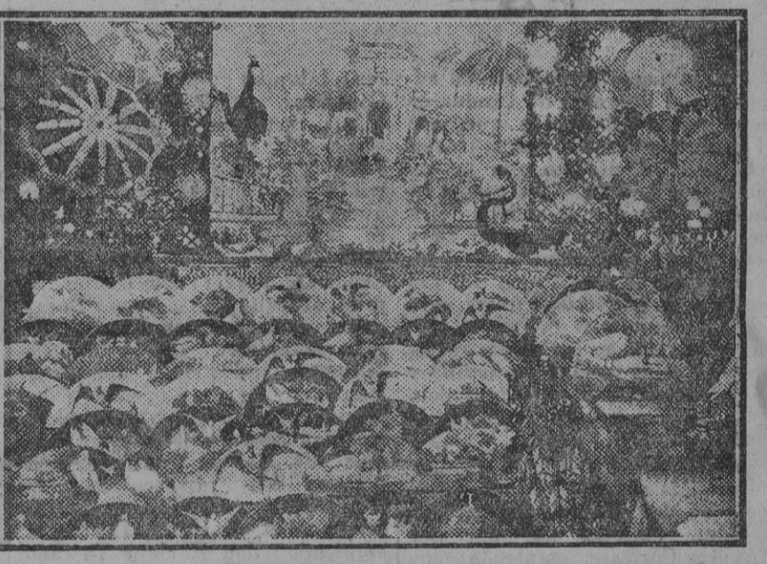
Una vista de la exposición de novedades para la temporada de verano en la Casa Rubio.

posición, que voy a repetir porque la gustado mucho. En la segunda se expondrán otros modelos raros, cosas que se le ocurren a los pintores de casa, que no paran de inventar cosas para la clientela de toda España. Verá usted en Mayo pajarillos en todas las tiendas. Un año vamos a pintar monos, a ver si los imitan. —Más pronto! No ve usted que los monos lo imitan todo... —Pues por eso. ¡Ha visto usted los modelos de sombrillas? Son exclusivos de la fábrica nuestra. Imi-