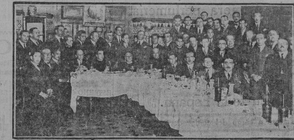
Hermanos de la Coirada del «Cachorro» que festejaron con un almuerzo la brillantez de los coitos a su titular, celebrados en la parroquia de Santa Ana.

EL LIBERAL publica sus ediciones: De la noche, en las páginas 1, 2 y 3. De la mañana, en las páginas 4, 5 y 6.