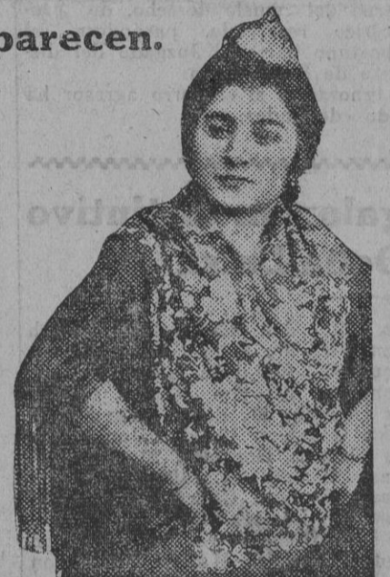
señorito levantando el campo y arrojando garata a la hora de «la dolorosa». Antiguamente se gastaban cien duros en vino y duraba la juerga tres días. Hoy, con las cosas raras que se beben y se comen, se gasta ese dinero en tres ó cuatro horas, y ya está la juerga de luto. Hay unos añicos de las juergas que antes se hacía con una colección de artistas jóvenes, guapas, bailando con estilo y echándole salero al baile, lo que se fué vuelve. ¡Mira que el encanto que tenga estar seis horas al lado de una señorita con un sombrero, escuchándole decir «no, ricos, «amos, ande», «que te crees tú eso...!» En una juerga se canta, se baila, se oye a Javier, al Niño de Huelva ó a Currito hacer filigranas con la guitarra, se bebe una copa a gusto ó se acaba á farolazos; pero se hace algo. ¡Tú no opinas lo mismo?

Avalorando su labor poética, la señora de Villalobos imprime a todas las composiciones el entusias-