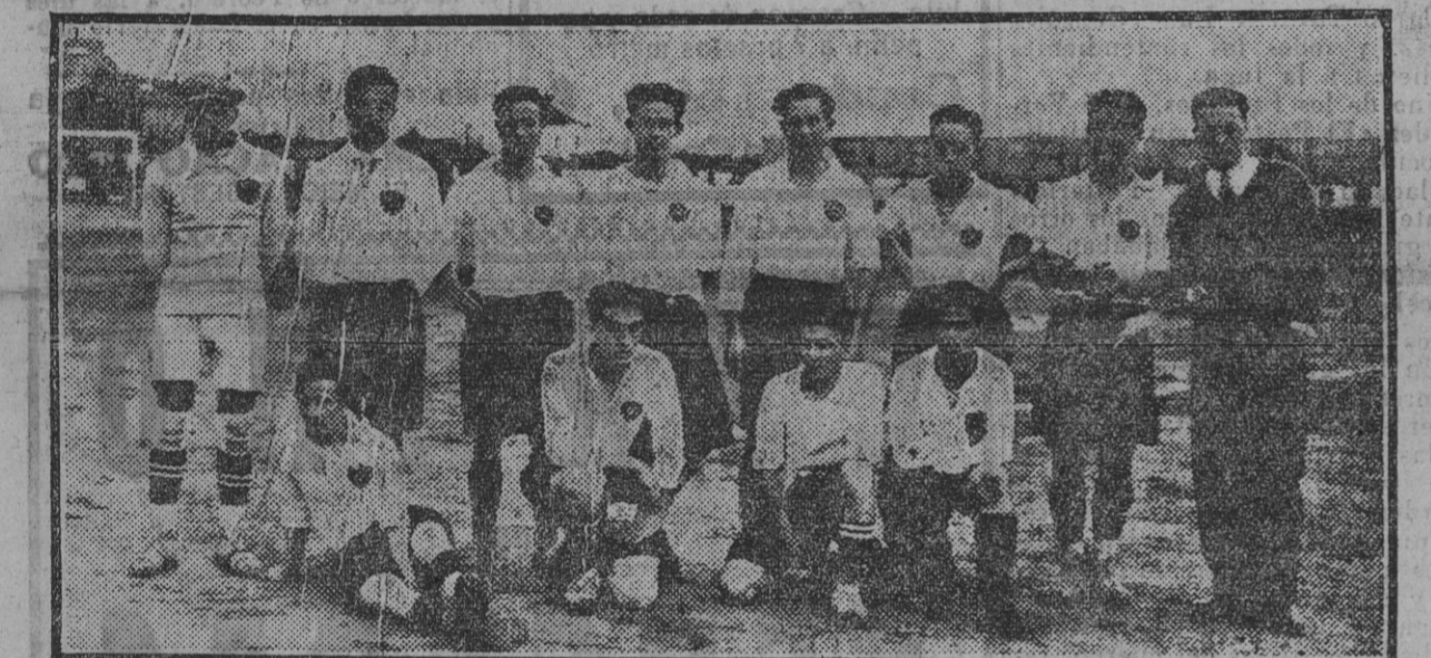
Equipo del "Gerez F. C.", que jugó ayer en el campo del Balompie con el "F. C. Malagueño". Foto. Sánchez del Pando. (Fdo. Gori.)

El Juzgado se encargará de aclarar este suceso.