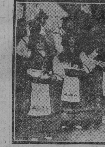
Bellas señoritas protectoras de la Federación de Sindicatos femeninos de Nuestra Señora de los Reyes, que interpretaron "La alborada gallega" en el festival celebrado ayer en el salón de actos de la Asociación de damas catequistas.