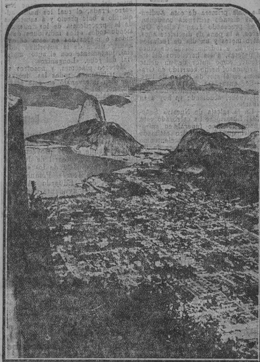
Una vista tomada desde un avión de la bahía de Rio Janeiro, a la que llegaron felizmente los tripulantes del "Plus Ultra".

EL LIBERAL publica sus ediciones: De la noche, en las páginas 1, 2 y 3. De la mañana, en las páginas 4, 5 y 6.