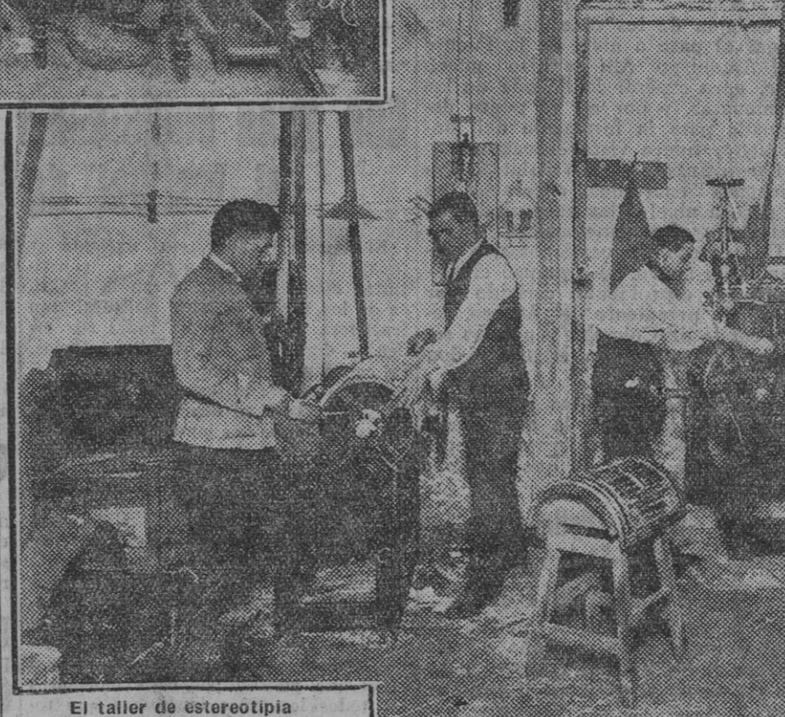
El taller de estereotipia. El público y nosotros. Cuando se instalaron nuestros talleres tipográficos vino por vez primera a Sevilla una instalación completa de fundición para el estereotipado de las planas y una magnífica rotativa para la tirada.