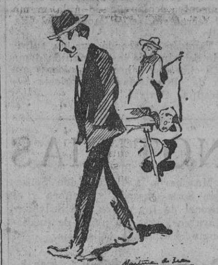
¿Quieres más castigo que haber vivido privado del amor de mi hija?

En el interior están preparados el apuntador ha vuelto á la concha; los trapusines han dado el aviso para que toquen la tercera. ¡Estamos! ¡Arriba! Los que vemos desde el público la función, para aplaudirla ó censurarla, ignoramos que de la batería adentro hay cien familias que obtienen en el teatro el pan nuestro de cada día. «La corte de Paroán» ha empezado. El desfile de mujeres guapas, que tanto agrada desde el público, no tiene en el escenario valor alguno. Nadie mira á nadie. Nadie da importancia á nada. Allí no hay reinas, ni princesas, ni esclavas, ni odaliscas. Sólo se ven bocas pintadas de rojo; pómulos color de rosa; ojeras betunadas; lentejuelas, pedrería falsa, y dentro de cada reina, de cada princesa, de cada odalisca, una tragedia horrible: la tragedia que supone tener que vivir con ocho á nueve pesetas de sueldo, porque no ganan más. —Y podemos llamarnos dichosas las que aquí trabajamos nueve me-