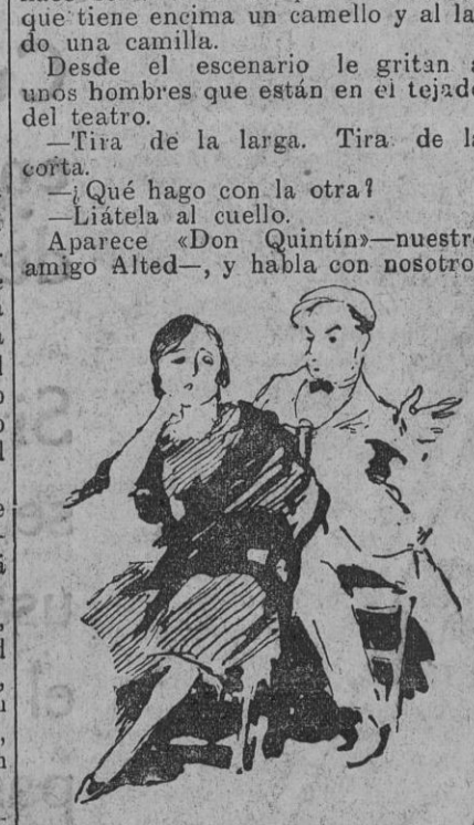
¿Te me has colado hasta lo más hondo del carburador!

Un hombre, con una blusa larga, hace sonar una campana de torre, que tiene encima un camello y al lado una camilla. Desde el escenario le gritan á unos hombres que están en el tejado del teatro. Tira de la larga. Tira de la corta. —¿Qué hago con la otra? —¡Líatela al cuello. Aparece «Don Quintín»—nuestro amigo Alted—, y habla con nosotros