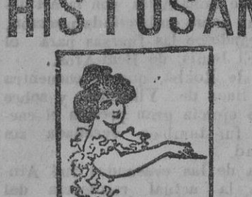
DELGADOS Y FLACOS