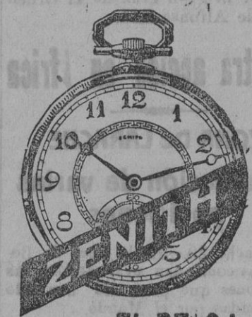
EL RELOJ PERFECTO