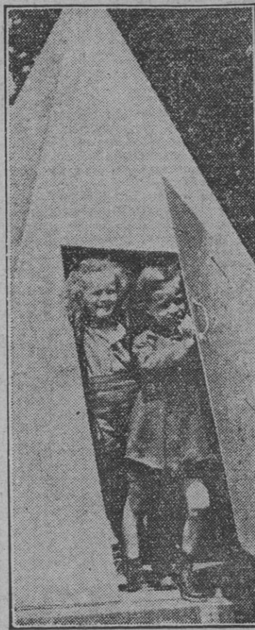
Un modelo pequeño de refugio antiaéreo norteamericano, con arreglo al cual se proyecta en Estados Unidos la construcción de muchos millares en tamaños mayores.