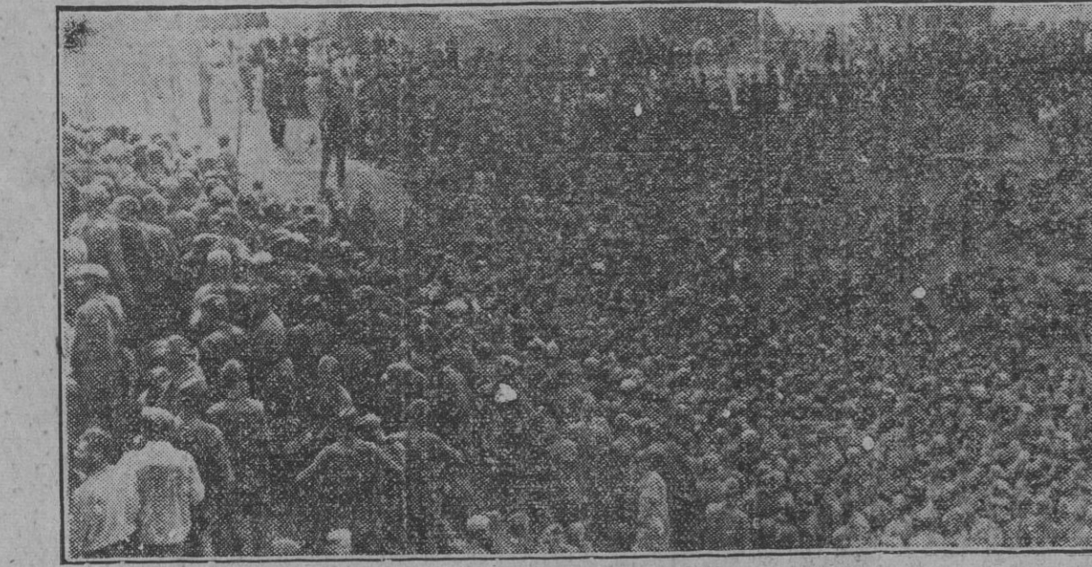
Después de las recientes operaciones de copo llevadas a cabo con gran éxito por las tropas alemanas, el número de prisioneros se eleva diariamente a elevadas cifras. He aquí un campo de concentración provisionalmente instalado en los nuevos territorios ocupados.