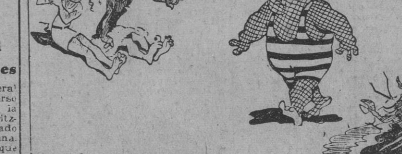
No te extrañe que tenga la piel así. Duermes todos los días al sol debajo de las redes.

Mediterráneo Central.—Nuestros cazas han sostenido un combate con una formación enemiga numéricamente superior. Dos Hurricanes han sido derribados. El aeródromo de Micaba, en la isla de Malta, fue atacado de nuevo por una escuadrilla de la Aviación Real." (Efe.)