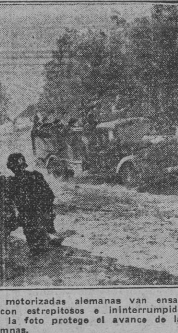
Siempre adelante. Las columnas motorizadas alemanas van ensanchando sus victoriosos e ininterumpidos triunfos. El cañón que se ve en la foto protege el avance de las columnas.