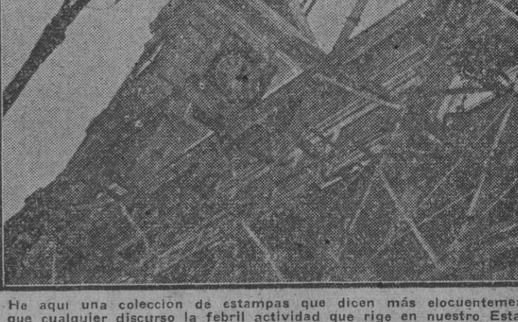
He aquí una colección de estampas que dicen más elocuentemente que cualquier discurso la febril actividad que rige en nuestro Estado Nacional-socialista. El sentido del trabajo ha recobrado plenamente su función, y por dondequiera que pase el viandante encontrará hombres que, herramienta en mano, se aplican a la reconstrucción y embellecimiento de la capital. Camino del del trabajo por el que se llega al cumplimiento de la consigna del Gaudillo: Ni un hogar sin pan y sinumbre.