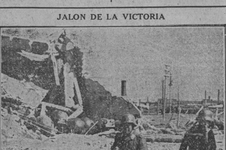
JALON DE LA VICTORIA Un depósito de minas en la bahía de Libau, volado por los Soviets en retirada. Un soldado y un marinero de las fuerzas de ocupación y desembarco alemanas, de guardia en la zona conquistada.