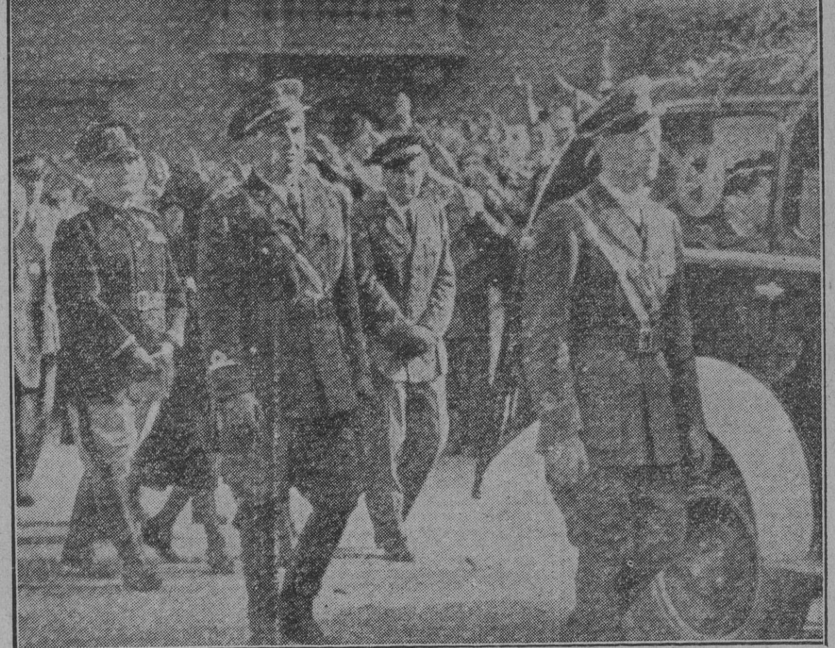
Mussolini, en el entierro de su hijo Bruno, preside el duelo de la nación italiana, que rinde homenaje al héroe caído en servicio de la Patria, en cuyas gloriosas hazañas ha sabido dejar prendido para la Historia el gallardo avión de su nombre.