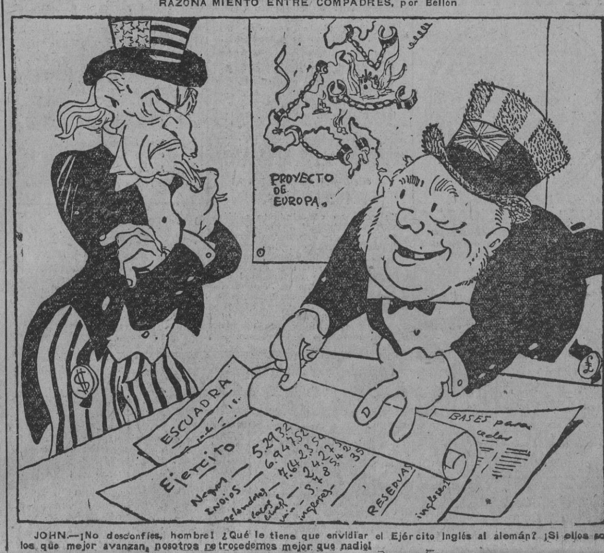
JOHN—No desconfíes, hombre! ¿Qué le tiene que envidiar el Ejército inglés al alemán? ¡Si ellos son los que mejor avanzan, nosotros retrocedemos mejor que nadie!

ANGORA, 15.—Radio Angora dice, refiriéndose a las afirmaciones de los periódicos ingleses de que al entregar la nota anglosoviética se hubiera hecho una declaración de garantías a Turquía, que semejante declaración de garantía es inadmisibles, ya que Turquía ha concluido sus acuerdos únicamente sobre la base de igualdad, y que no estaba dispuesta a aceptar garantías. En el comunicado de la Radio se pone de relieve que Turquía no está expuesta a ningún peligro inmediato. (Efe.)