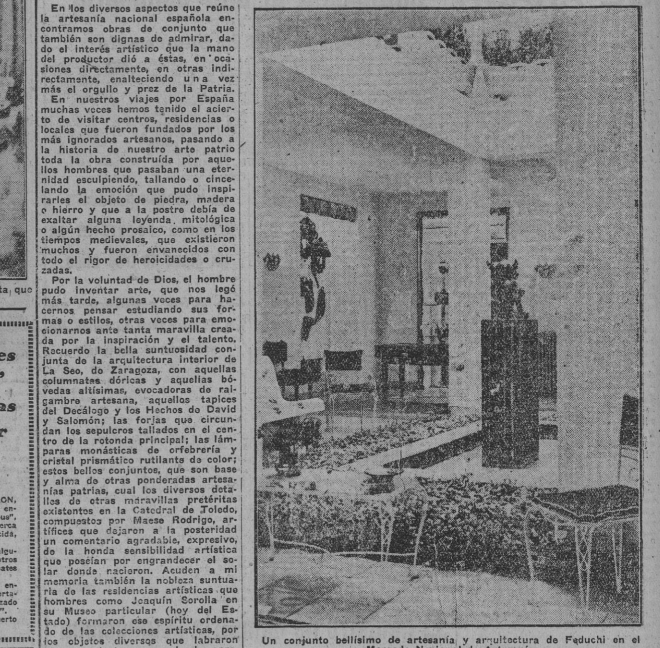
Un conjunto bellissimo de artesanía y arquitectura de Feduchi en el Mercado Nacional de Artesanía.