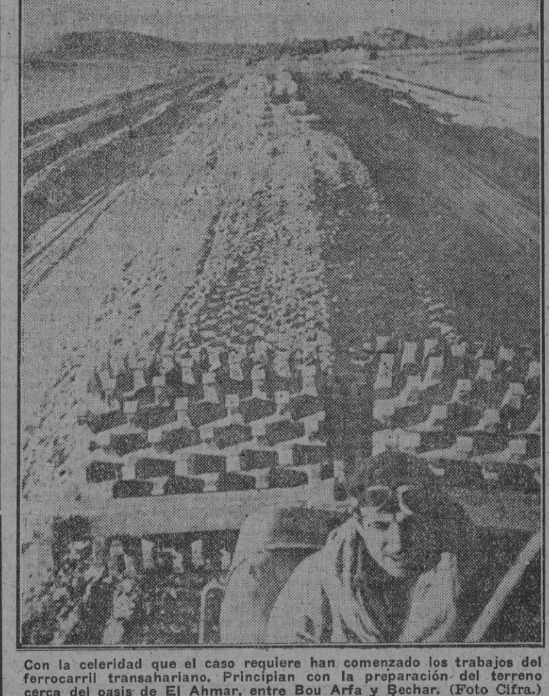
Con la celeridad que el caso requiere han comenzado los trabajos del ferrocarril transahariano. Principian con la preparación del terreno cerca del oasis de El Ahmar, entre Bou Arfa y Bechar.