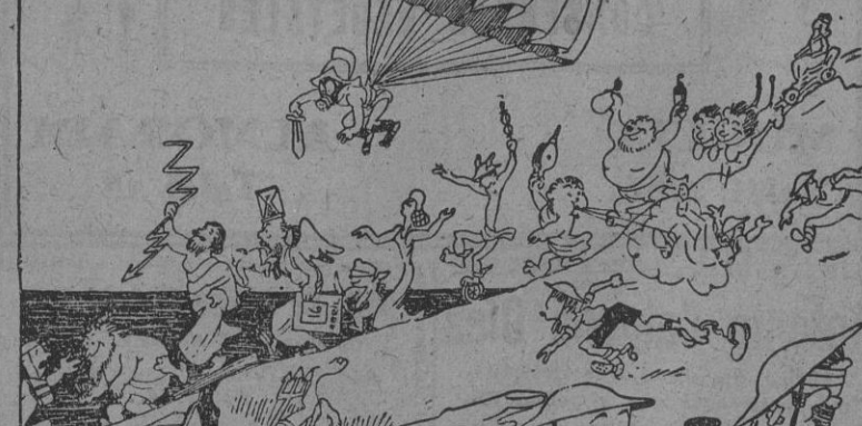
—A sus órdenes, sir! ¡Nadie queda atrás! ¡Nos hemos traído hasta los dioses del Olimpo!