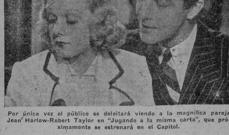
Por única vez el público se deleitará viendo a la magnífica pareja Jean Harlow-Robert Taylor en "Jugando a la misma carta", que próximamente se estrenará en el Capitol.