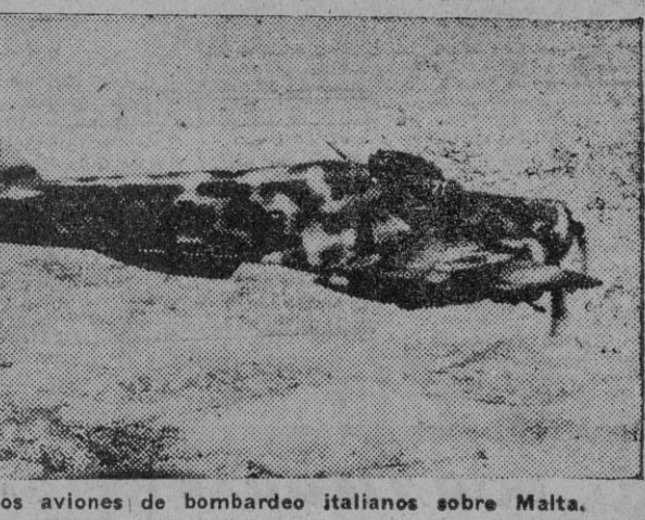
Ataque de los aviones de bombardeo italianos sobre Malta..