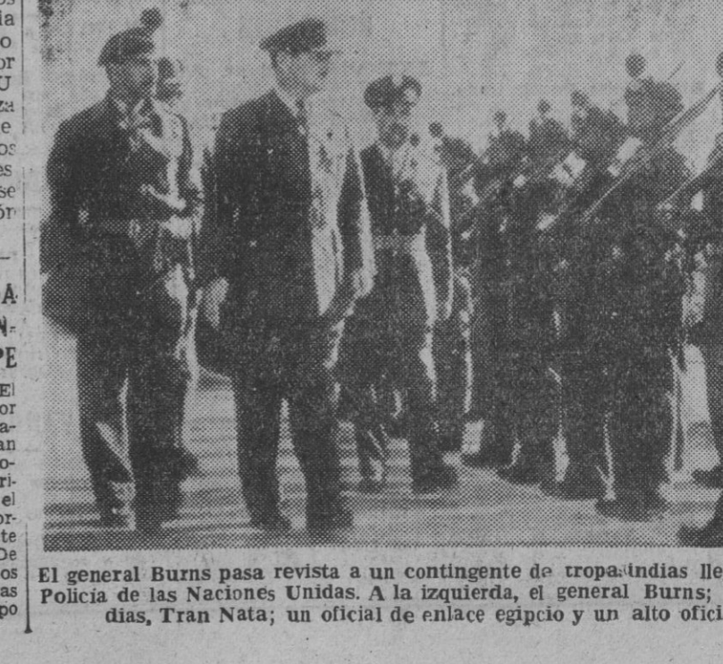
El general Burns pasa revista a un contingente de tropas indias llegadas a Egipto, para reforzar la Policía de las Naciones Unidas. A la izquierda, el general Burns; el comandante de las tropas indias, Tran Nata; un oficial de enlace egipcio y un alto oficial de las fuerzas de la ONU.