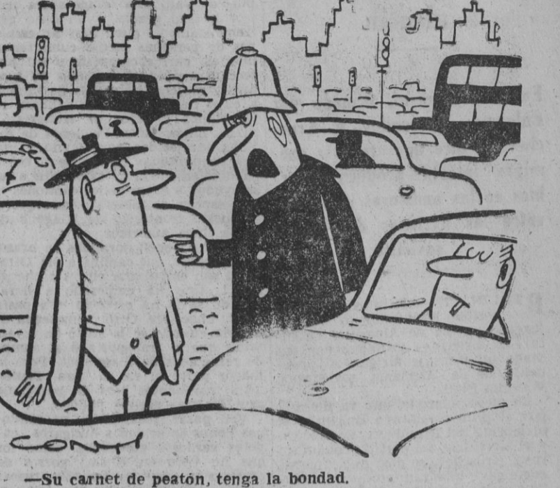
- Su carnet de peatón, tenga la bondad.