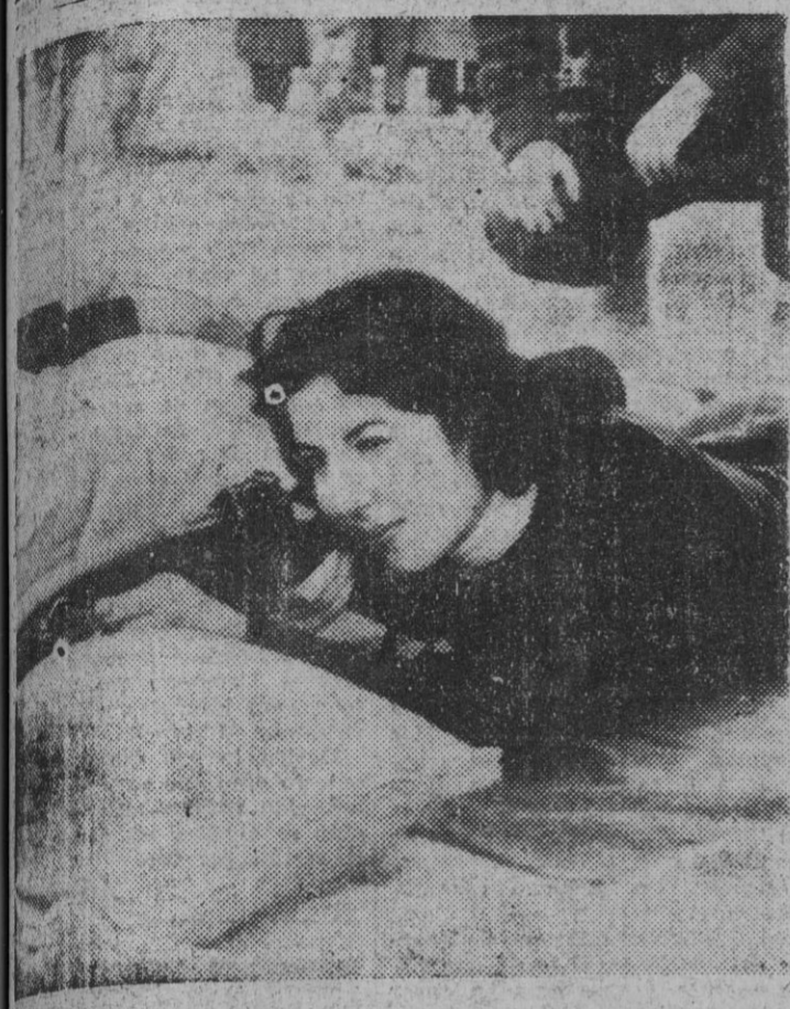
DAMASCO. — Hanaa, hija del presidente Soukry el Kuwaty, es la hija del presidente sirio en El Cairo, realizando prácticas de tiro con un campo de las afueras de esta capital.

Hija del presidente sirio practica el tiro