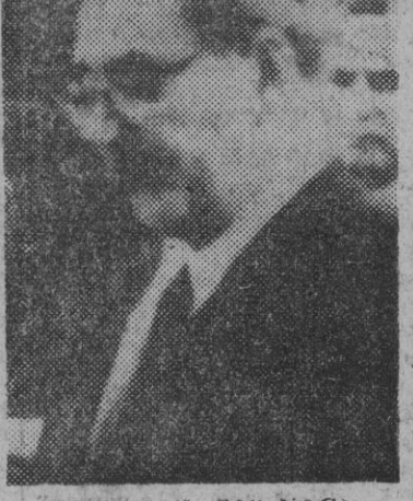
El "TIPOISTA" NAGY

Imre Nagy fue miembro de la Junta Directiva del Partido Comunista húngaro. Nació en 1895 de familia campesina. Recibió enseñanza elemental. Paso los primeros años del Régimen de Hurthy en el extranjero, marchó a la U. R. S. S. después de 1930 y se especializó en la reforma agraria soviética. Después de la segunda guerra mundial, volvió a Hungría y fue nombrado ministro de Agricultura en el Gobierno provisional de 1944. Presidente de la Cámara de Representantes en septiembre de 1947, cayó después en desgracia acusado de desviacionismo, volvió a ocupar el Poder unos pocos días antes que los tanques soviéticos aplastaran la revolución en Budapest.