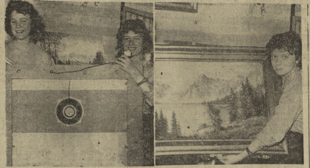
REVOLUCION EN EL MUNDO DE LA RADIO — Acaba de presentarse en Alemania una idea original que va a revolucionar el diseño de los futuros aparatos de radio...

TRAJES A PLAZOS... EN AUMENTO. SEÑORA Y CABALLERO. TRAFALGAR, 5.1