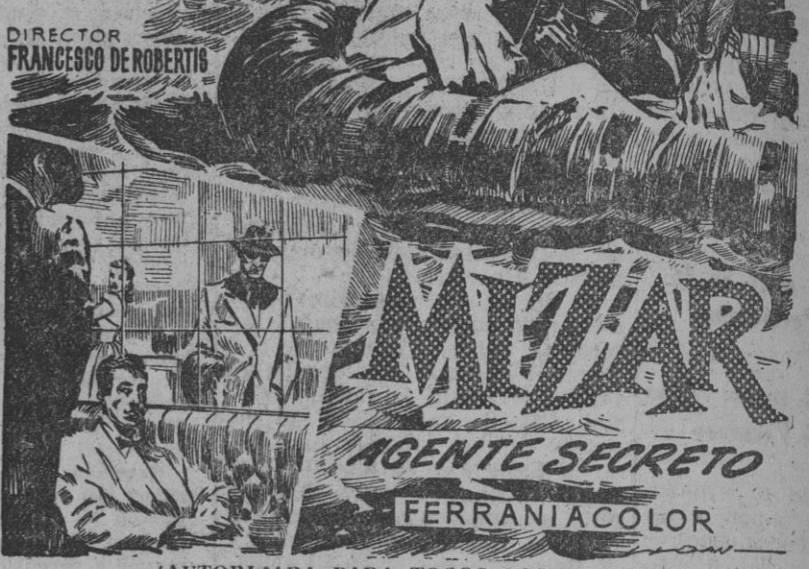
(AUTORIZADA PARA TODOS LOS PUBLICOS)