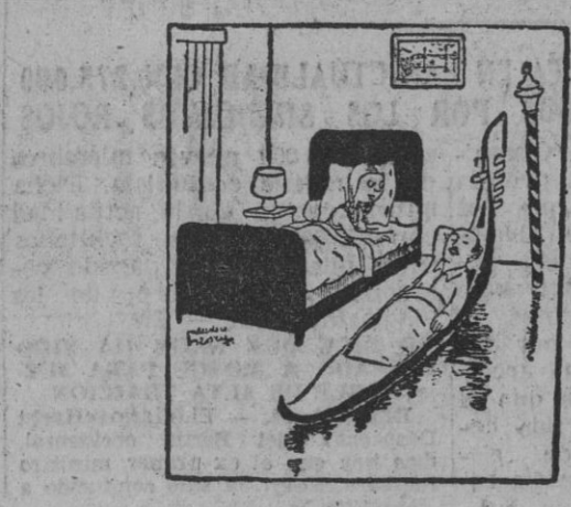
—¿Emilio! Déjame subir en tu sueño.