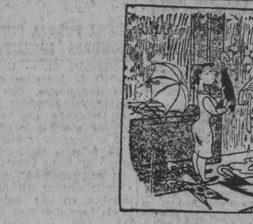
—¿Se lo envuelvo?