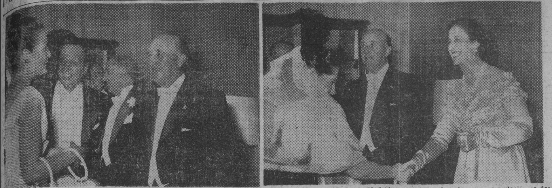
En asistencia de SS. EE. el Jefe del Estado y su egregia esposa, se ha celebrado, en el Teatro de la Zarzuela, de Madrid, una función de gala, cuya recaudación se dedica a la Campaña de Navidad. Se puso en escena "Doña Francisquita", y a la representación asistieron también el ministro de Información y Turismo, don Gabriel Salgado, y destacadas personalidades. En la primera fotografía, el Generalísimo conversando con la artista Carmen Sevilla, durante un momento del descanso, y en la segunda, Franco y su esposa felicitan a los protagonistas de la obra.