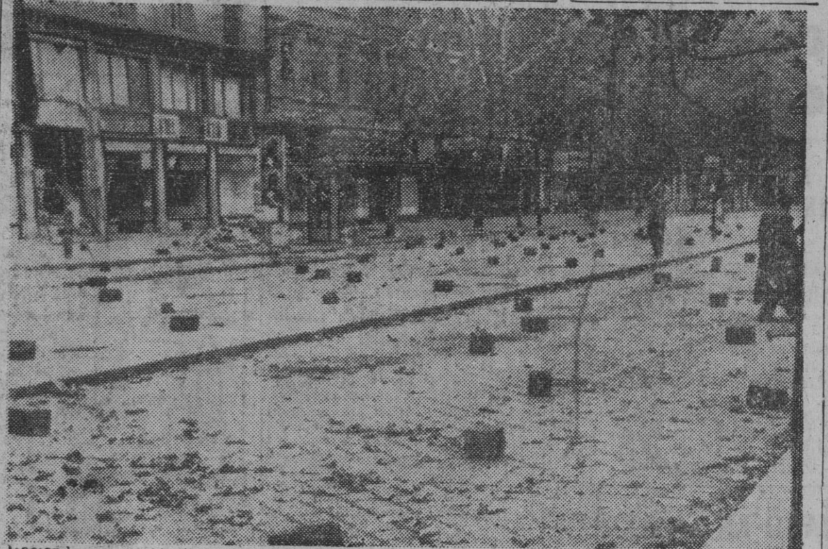
haciendo caso omiso de engañosas promesas y desahucando las brutales medidas represivas, los trabajadores húngaros prosiguen la huelga general, plantándole cara al «Gobierno títere» de Kadar. En esta calle de un barrio obrero de Budapest, las luchas sostenidas por los patriotas contra los invasores se reflejan en la calzada obstruida por adoquines y objetos diversos, así como en los escaparates rotos de las tiendas que aparecen en segundo plano.