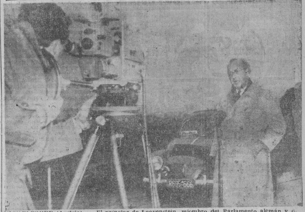
NICKELSDORF (Austria). — El príncipe de Loevenstein, miembro del Parlamento alemán y de la Misión de la Cruz Roja, que fué a Hungría, se retrata en la frontera húngara después de haber sido libertado por los rusos, que le arrestaron cuando se hallaba en cumplimiento de sus deberes humanitarios.

Importantisimo discurso del señor Martín Artajo ante la Asamblea general de la O. N. U.