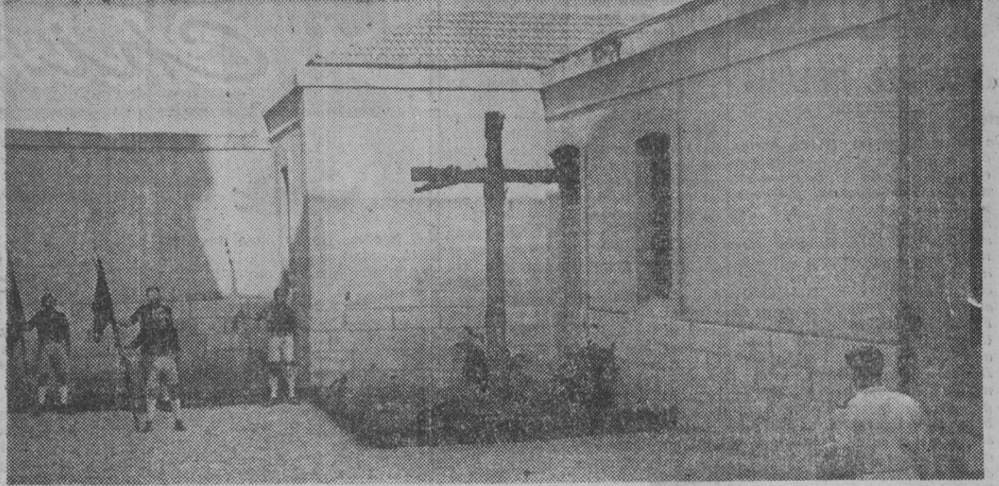
En dos momentos, dos estampas, del paso de José Antonio por la política nacional. En la primera, una de sus clásicas actitudes durante el discurso pronunciado en el cine Valiadiol. En la segunda, el rincón del patio de la prisión de Alicante, con la cruz que señala el lugar en donde cayó inmolado por los enemigos de España.