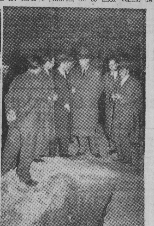
Cuando estaban trabajando en las obras de construcción de una zanja para los cimientos de un edificio, en el solar de la calle Balmes, 310, ayer tarde se produjo un corrimiento de tierras que dejó sepultados a cuatro obreros. Inmediatamente comenzaron los trabajos de salvamento, acudiendo para ello personal del Cuartel Central de Bomberos quienes, después de graves riesgos, lograron extraer, sin vida, a los cuatro infortunados trabajadores. La información gráfica de nuestro redactor Pérez de Rozas muestra, en primer término, el lugar del siniestro; segundo, el dramático momento de la extracción de una de las víctimas, y, finalmente, el gobernador civil, don Felipe Acedo, y otras autoridades, que acudieron inmediatamente al lugar del suceso.

que habían alcanzado, estuviesen aseguradas con las prudentes medidas de apuntalamiento y seguridad que, para evitar precisamente accidentes como el ocurrido, debían guardarse en relación con las características de la obra y del terreno en que este tenía lugar. Los técnicos que llegaron al lugar del suceso cifran en unos veinte metros cúbicos de tierra la cantidad deslizada que, debido al grado de humedad que presentaba, se calcula que debía alcanzar alrededor de unas treinta toneladas de peso.